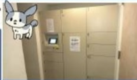
便利な宅配ボックス