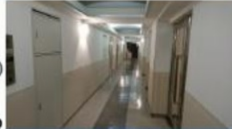
ホテルライクな内廊下