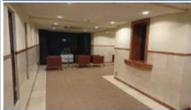
落ち着いた雰囲気のエントランスロビー