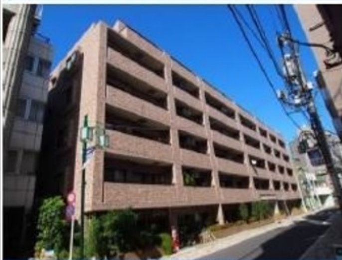
タイル貼りの建物外観