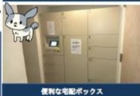
便利な宅配ボックス

<共用部分>オートロック(ディンプルキー)・宅配ロッカー・エレベーター・防犯カメラ・24時間ゴミ出し可