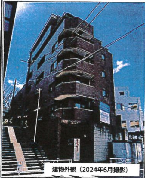
建物外観 (2024年6月撮影)