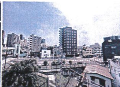
※バルコニーからの眺望