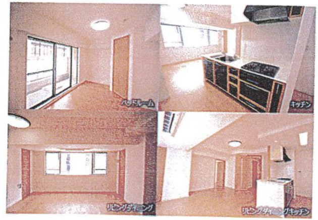
※このハウジングマップは概要紹介図です。形状等が現況と異なる場合は現況優先となることをご了承願います。