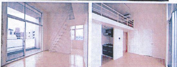
※9階の同じ間取タイプを撮影。仕様が異なることがあります。