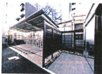
宅配ロッカー有 エレベーター有