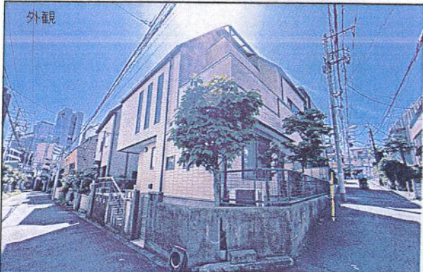
渋谷区代々木3丁目の 閑静な住宅街に立地