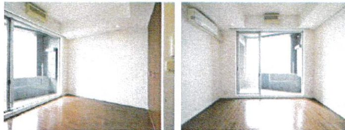
※5階の同じ間取タイプを撮影。仕様が異なることがあります。