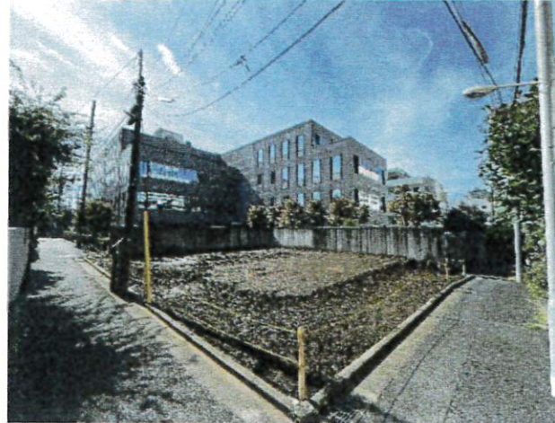
※2024年10月撮影。B号棟は写真の真ん中になります。