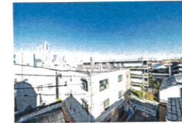
現況と図面等が相違する場合は現況を優先させていただきます。