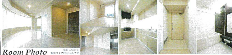
Room Photo 撮影:2018年