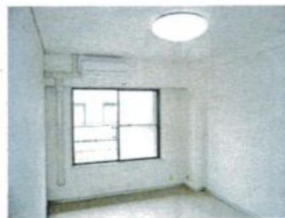
システムキッチン