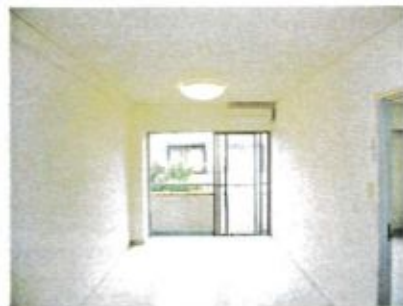
バルコニーに面したリビング