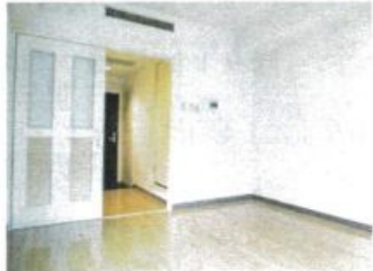
写真は別室のものです